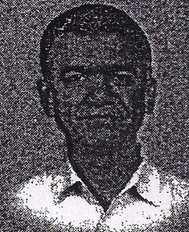
Sri Krishna Byre Gowda Hon'ble Minister of State for Agriculture Govt. of Karnataka