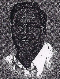
Sri Siddaramaiah Hon'ble Chief Minister Govt. of Karnataka